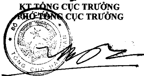
Hoàng Việt Cường