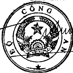
Trung tướng Tô Lâm