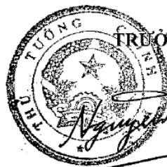
PHÓ THỦ TƯỚNG Nguyễn Thiện Nhân

Bộ trưởng, Thủ trưởng cơ quan ngang Bộ, Thủ trưởng cơ quan thuộc Chính phủ, Chủ tịch Ủy ban nhân dân các tỉnh, thành phố trực thuộc Trung ương có trách nhiệm tạo điều kiện để Ban Chỉ đạo 150 thực hiện nội dung, kế hoạch triển khai Quyết định số 150/QĐ-TTg ngày 14 tháng 01 năm 2013 của Thủ tướng Chính phủ về phê duyệt Đề án xác định hài cốt liệt sĩ còn thiếu thông tin./