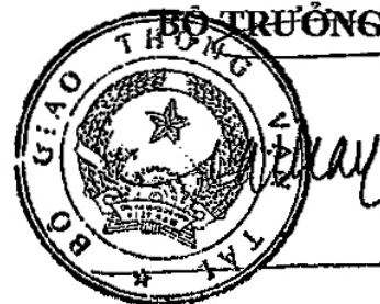
Đinh La Thăng