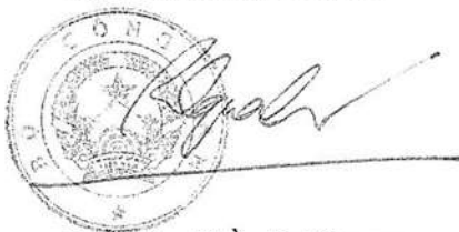
Đại tướng Trần Đại Quang