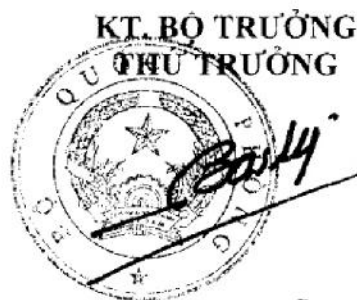
Thượng tướng Đỗ Bá Tỵ