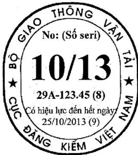
Tem kiểm định cho xe cơ giới