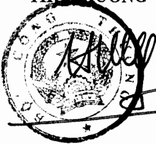
Cao Quốc Hưng