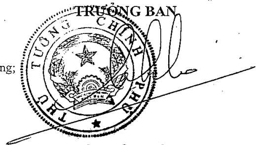
PHÓ THỦ TƯỚNG Trương Hòa Bình