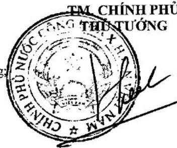
Nguyễn Xuân Phúc