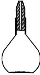
a) Bình đo tỉ trọng nút nhám có mao quản