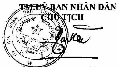
Nguyễn Văn Cao