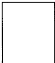
Ảnh chân dung 4 x 6