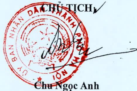
Chu Ngọc Anh