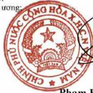
Phạm Bình Minh

TM. CHÍNH PHỦ KT. THỦ TƯỚNG PHÓ THỦ TƯỚNG